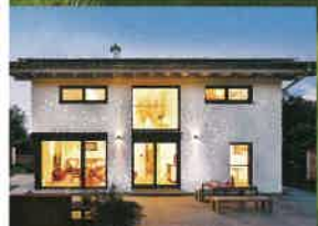
WELT IM BLICK HÄUSER