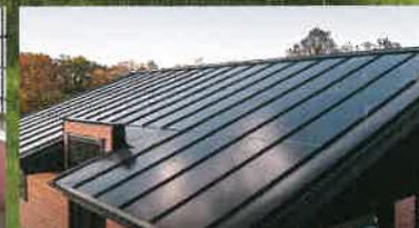
SMART MIT SONNENKRAFT