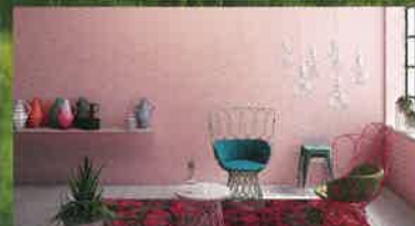
GROSSES SPEZIAL WOHNGESUND