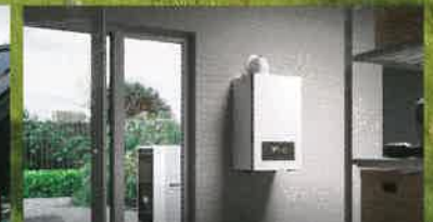
WÄRMEWENDE BEIM HEIZEN

UNFTSFÄHIG BAUEN & SANIEREN • NEUES HEIZUNGSGESETZ: KOMMT AUF SIE ZU? • NATÜRLICH DÄMMEN: DACH & FASSADE