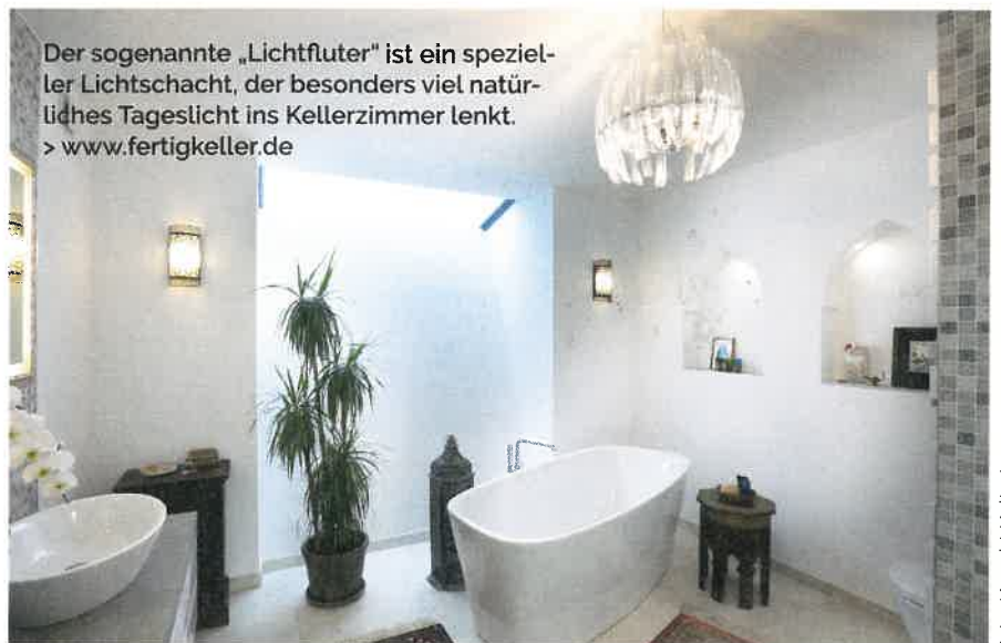
Der sogenannte „Lichtfluter“ ist ein spezieller Lichtschacht, der besonders viel natürliches Tageslicht ins Kellerzimmer lenkt. > www.fertigkeller.de